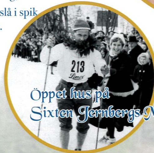
Öppet hus på Sixten Jernbergs Museum